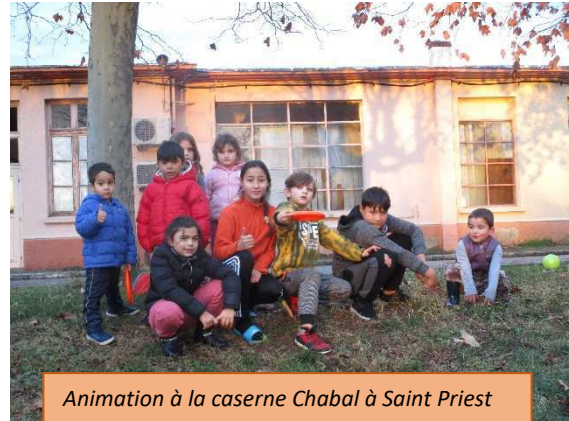
Animation à la caserne Chabal à Saint Priest

Comme présagé en fin d'année 2017, la stabilité des actions et notamment celle menées avec l'école n'aura été que de courte durée. Ces nouveaux changements, avec la redéfinition du périmètre d'intervention de l'Arche de Noé, a permis de recentrer les forces humaines et les compétences même si la question de la plus-value pédagogique pour les enfants se pose. Les temps proposés ne sont pas tous investis par les familles et posent la question de leurs pertinences. Une évaluation devra être menée et des actions correctives apportées.