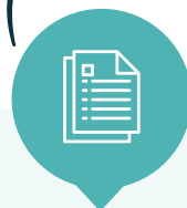
Dossier de candidature